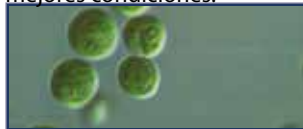
Chlorella pyrenoidosa x 1000