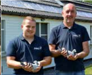
Famille 3 D