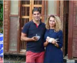
Hok SG Scherre